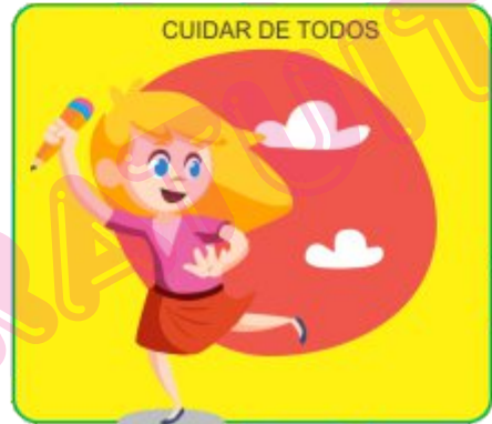
CUIDAR DE TODOS