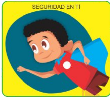
SEGURIDAD EN TÍ