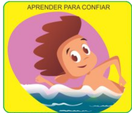
APRENDER PARA CONFIAR