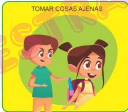
TOMAR COSAS AJENAS